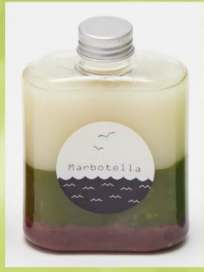
大人気のボトルドリンク 「伊勢茶の甘酒和り」