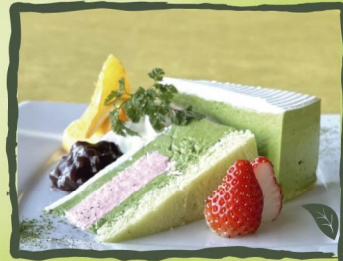
伊勢抹茶とほうじ茶のパウンドケーキ