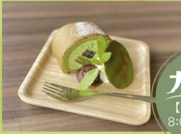
ホテルオリジナル 「伊勢茶ロールケーキ」