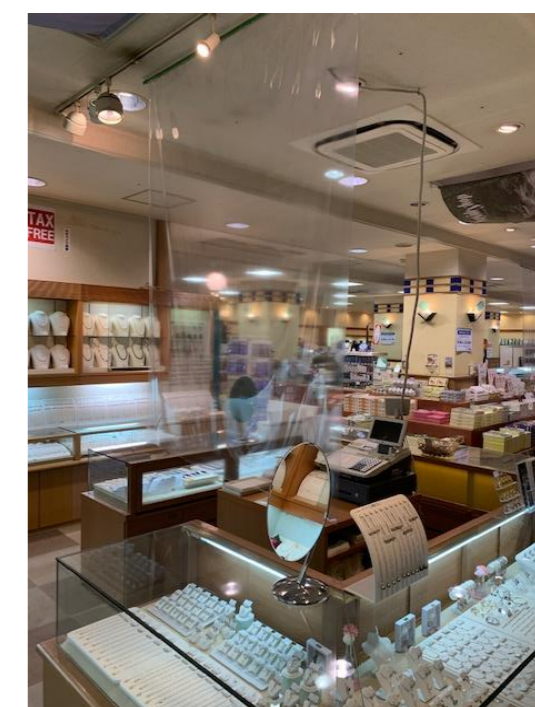
↑売店 飛沫感染防止シート