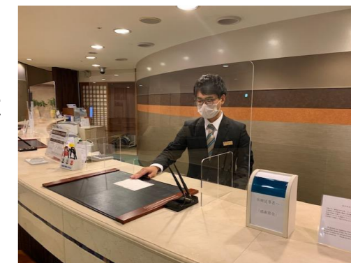
フロントカウンター → 飛沫感染防止アクリル板