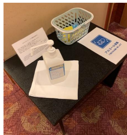
←アルコール消毒(食事会場前)